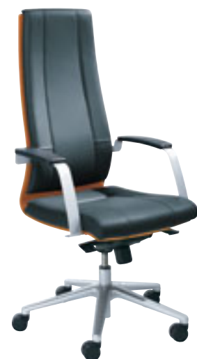
① Directiestoel met excentrisch kantelmechanisme