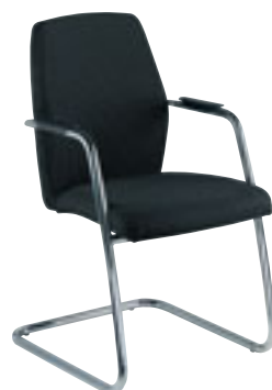
④ Set van 2 bezoekersstoelen