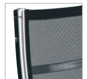
Rugleuning met slijtveste netbespanning